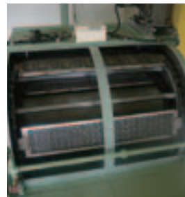
スラッジ搬出状況