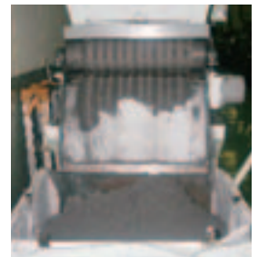
スラッジ絞り状況