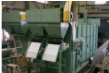
TRAP-3000型 循環処理量 3000L/mm