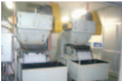
TRAP-1600型 循環処理量 1600L/mm